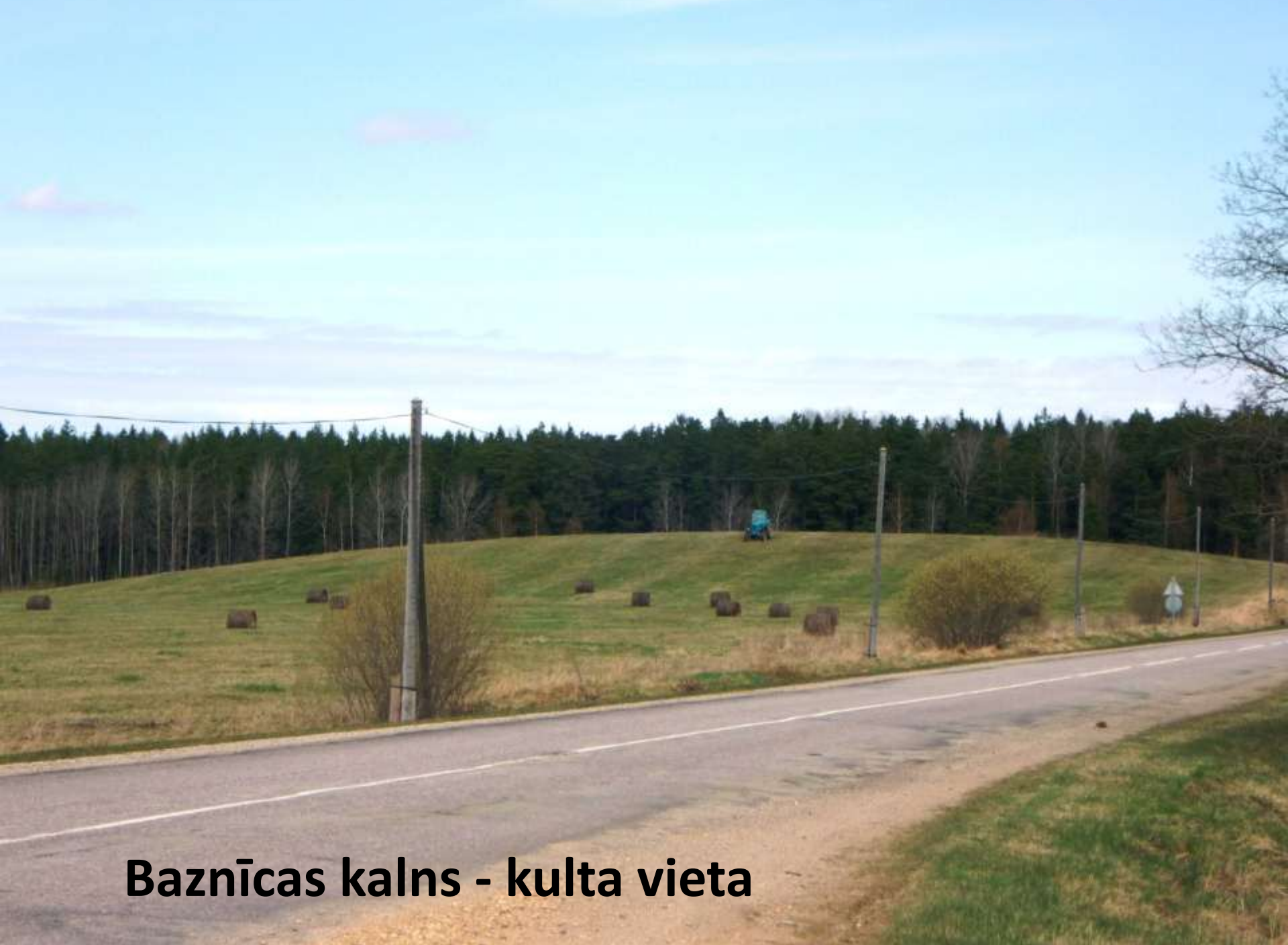
Baznīcas kalns - kulta vieta