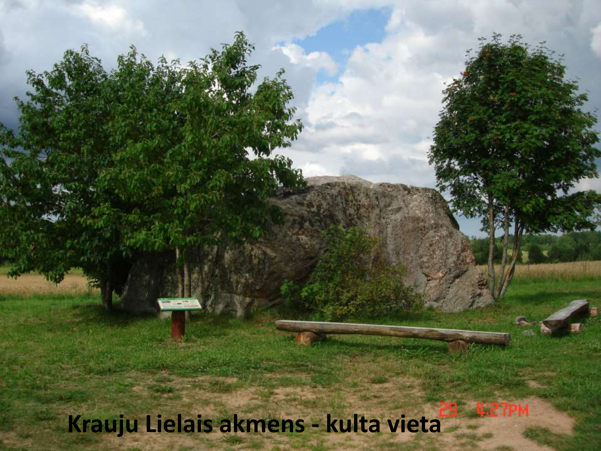
Krauju Lielais akmens - kulta vieta