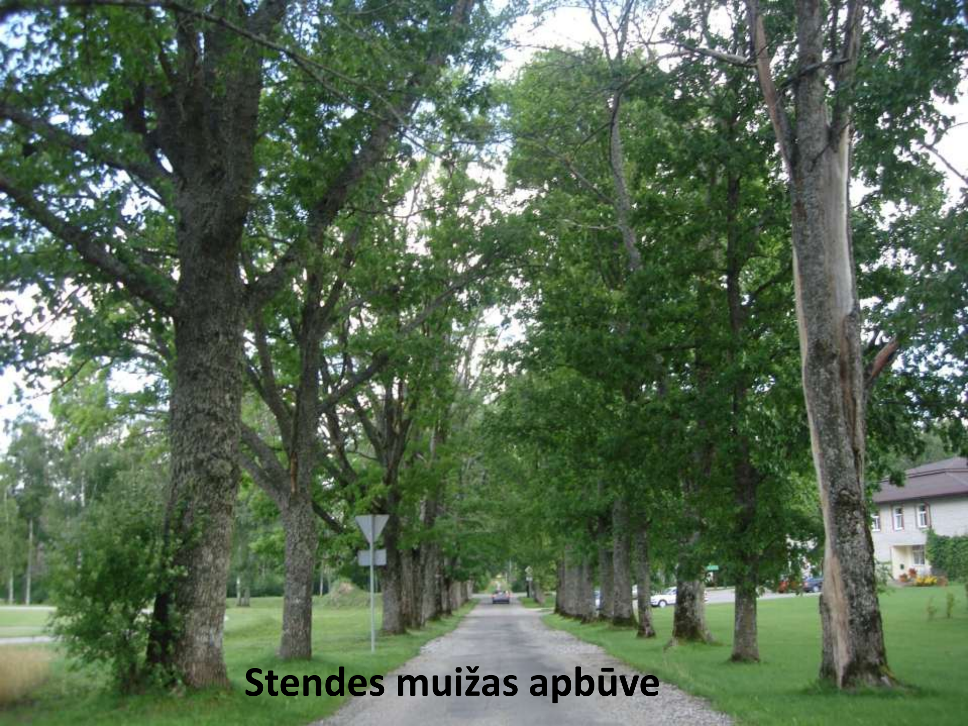
Stendes muižas apbūve