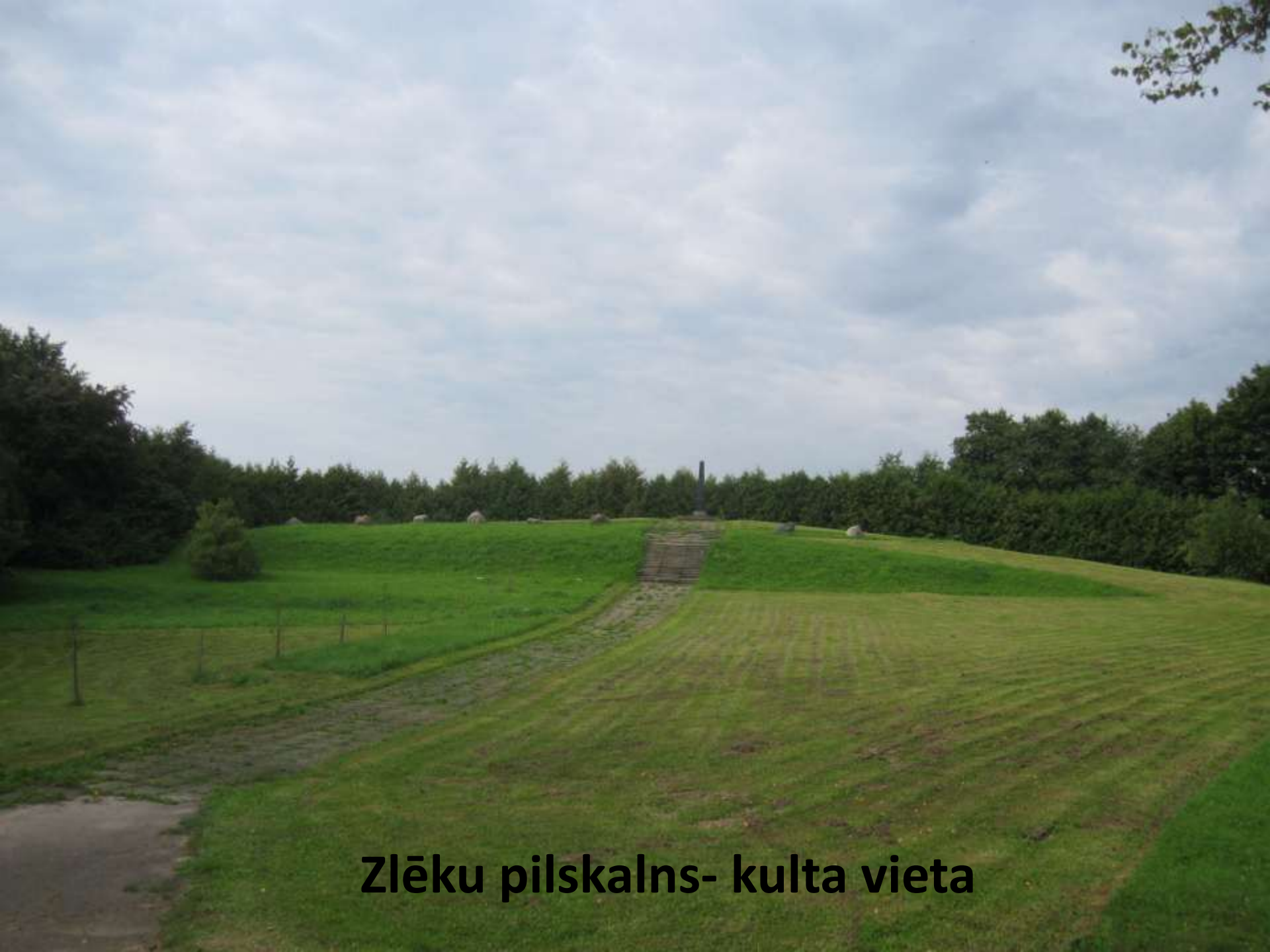
Zlēku pilskalns- kulta vieta