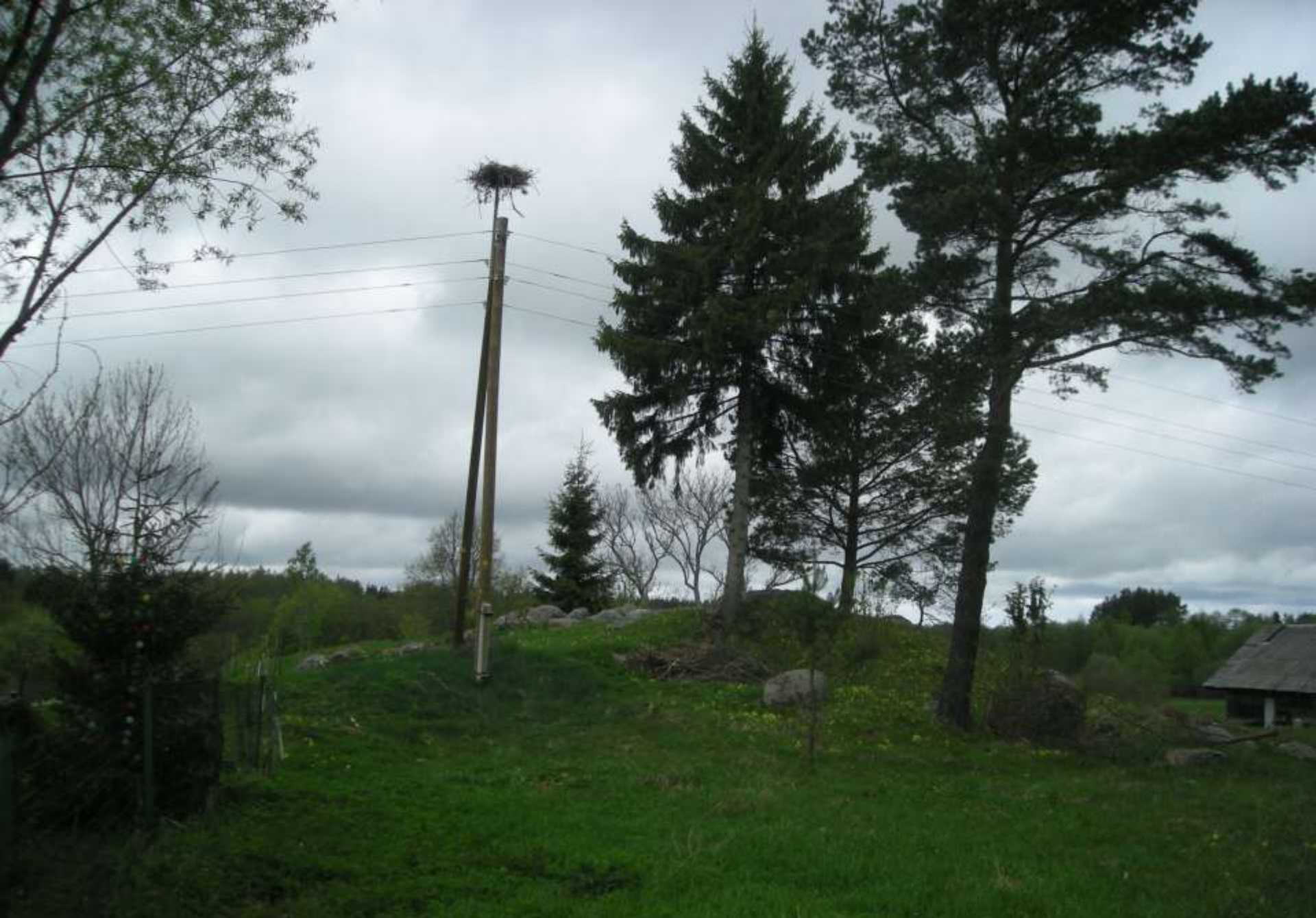
Mazistabu Stieguļu kalns - kulta vieta