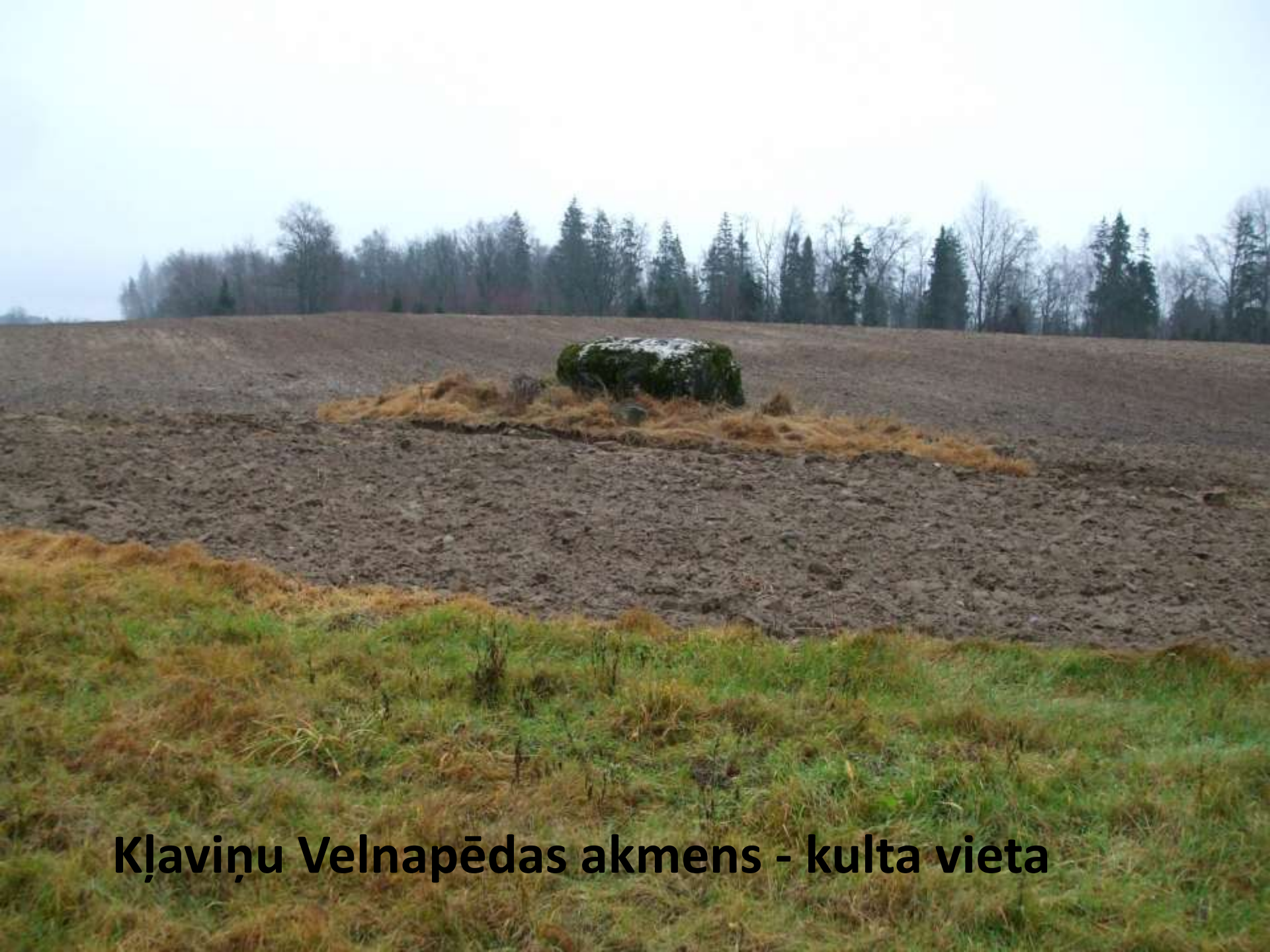
Kļaviņu Velnapēdas akmens - kulta vieta