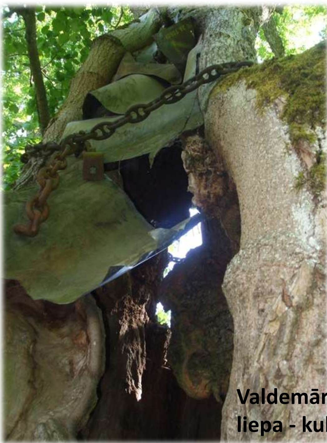
Valdemārpils Elku liepa - kulta vieta