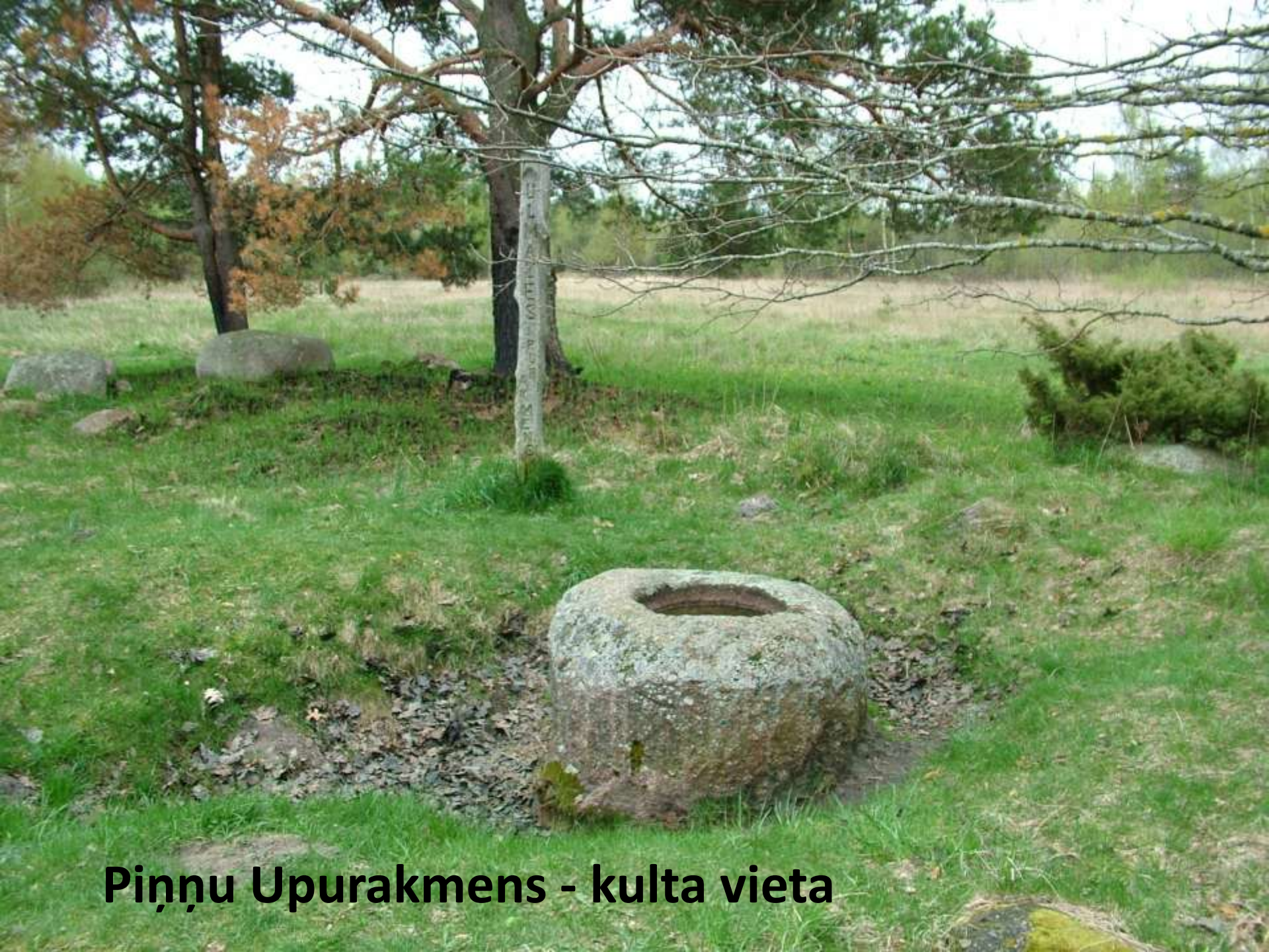
Piņņu Upurakmens - kulta vieta