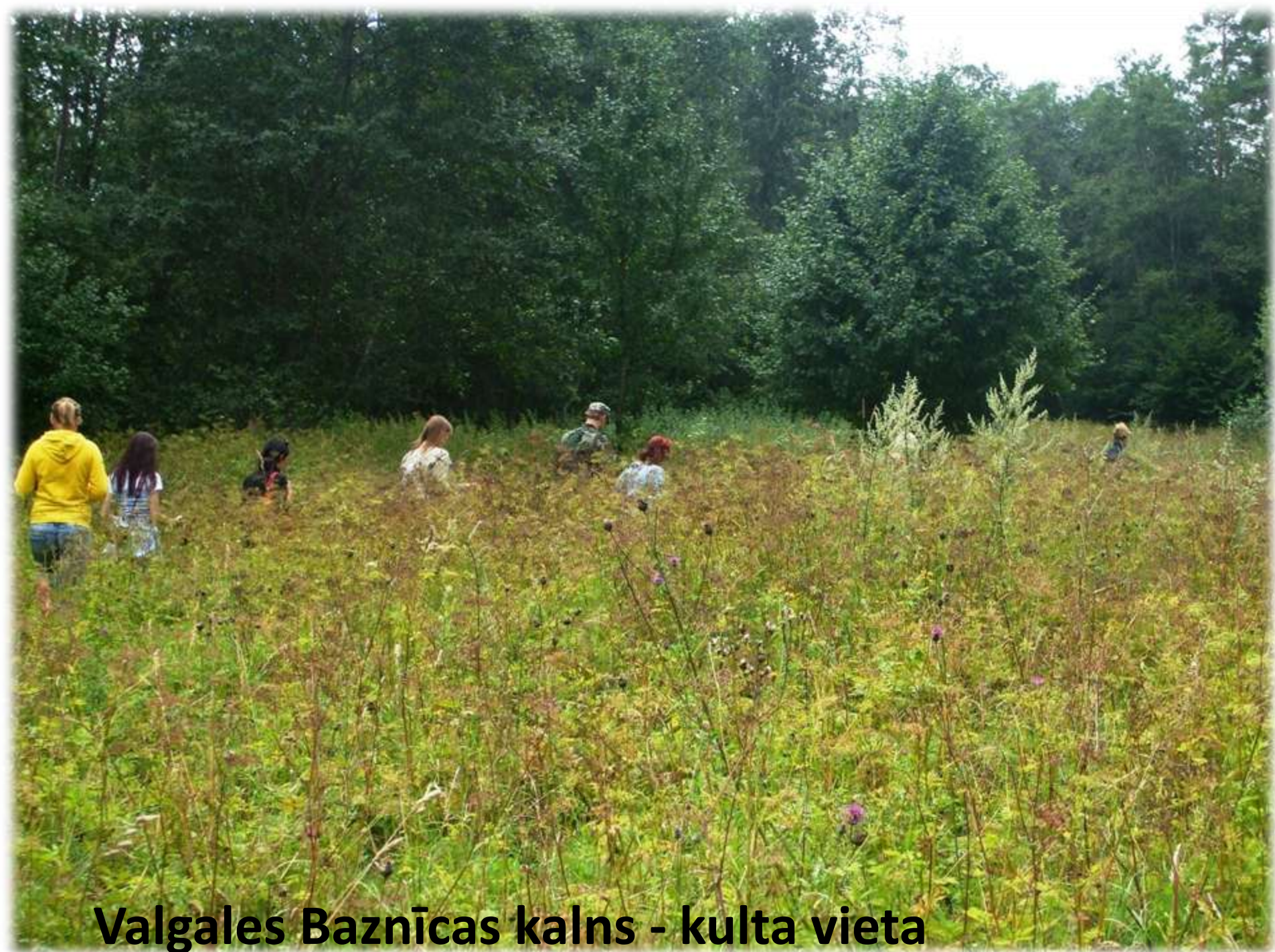
Valgales Baznīcas kalns - kulta vieta