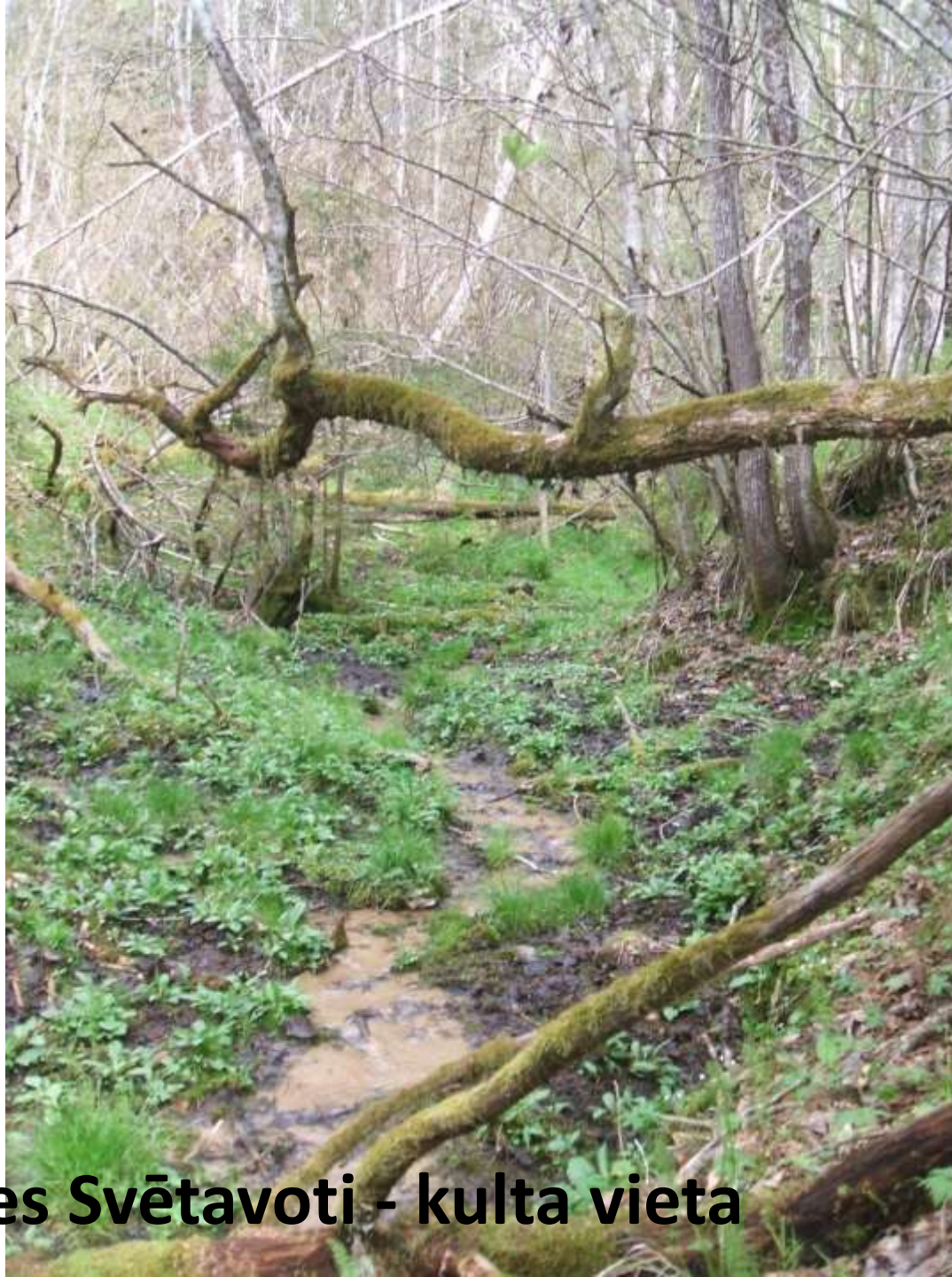
Elderenes Svētavoti - kulta vieta