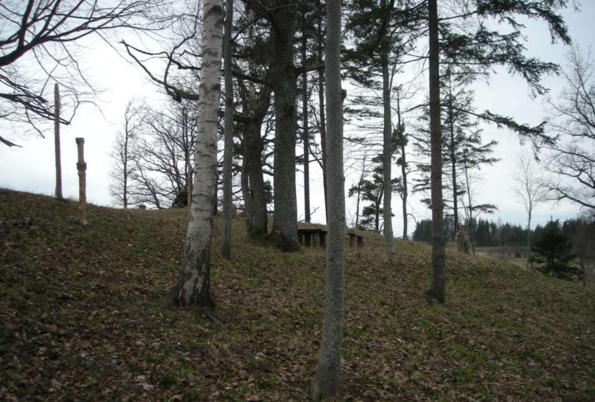
Vanagkalns (Upurkalns) - kulta vieta