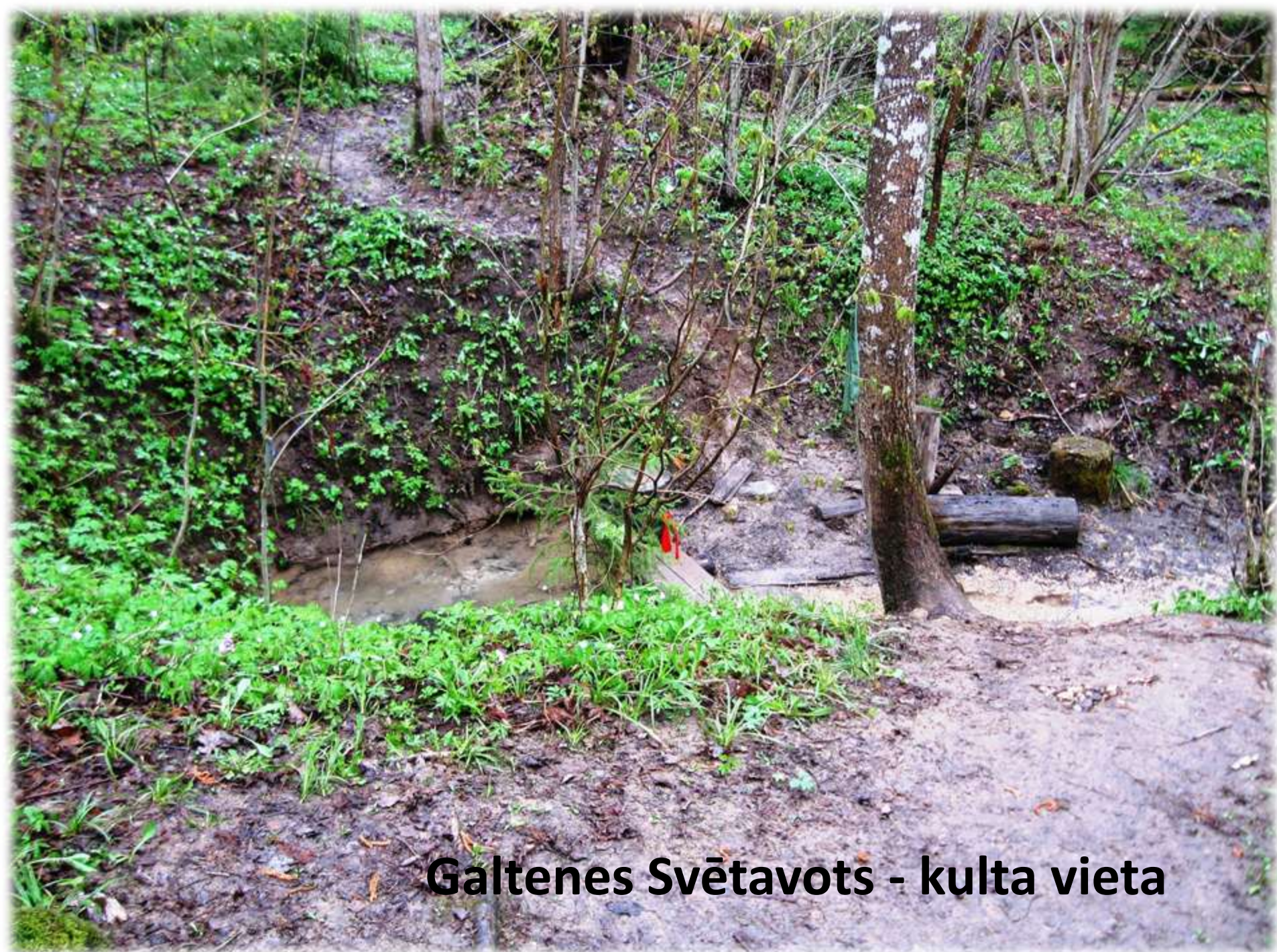
Galtenes Svētavots - kulta vieta