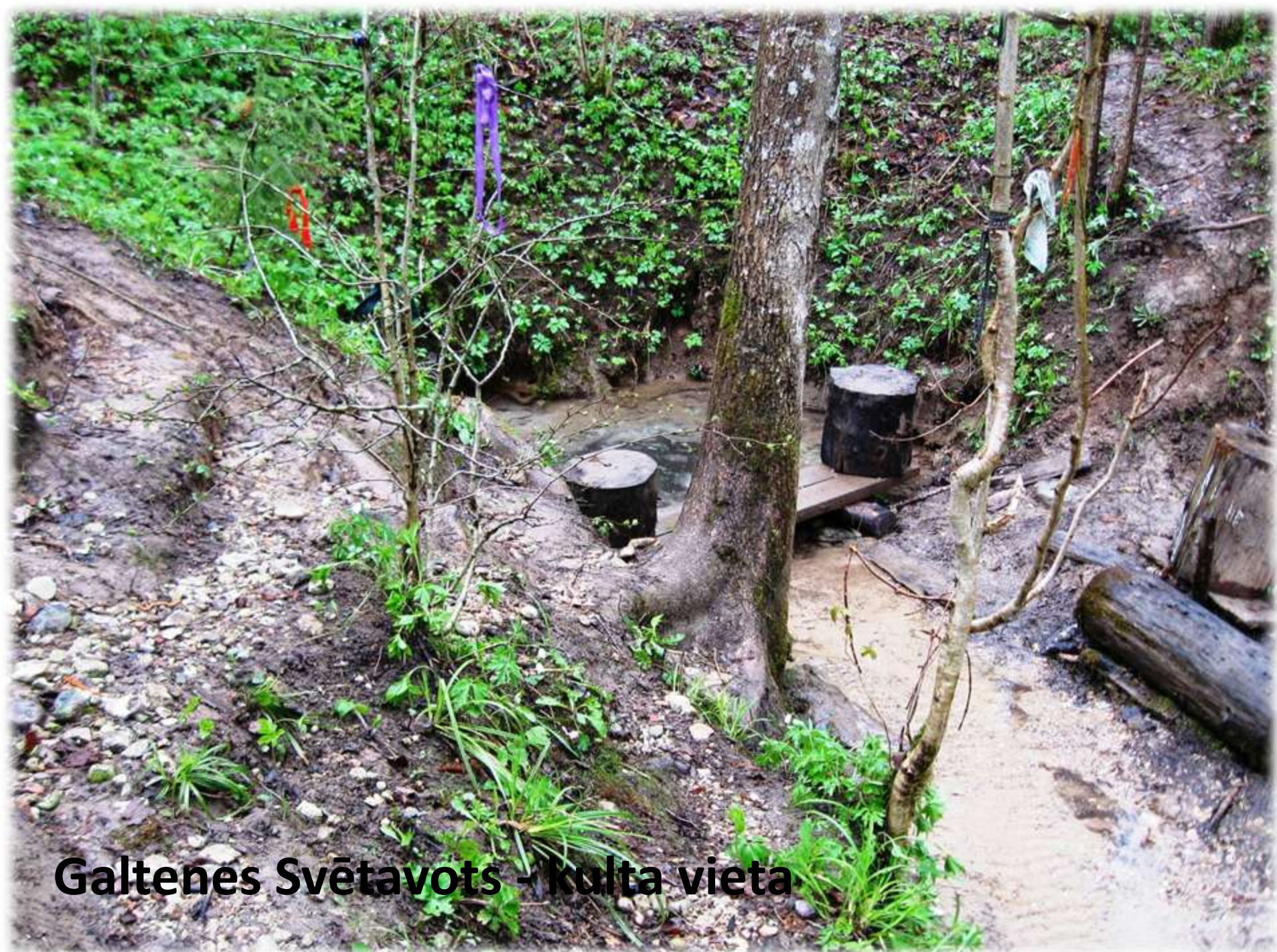
Galtenes Svētavots - kulta vieta