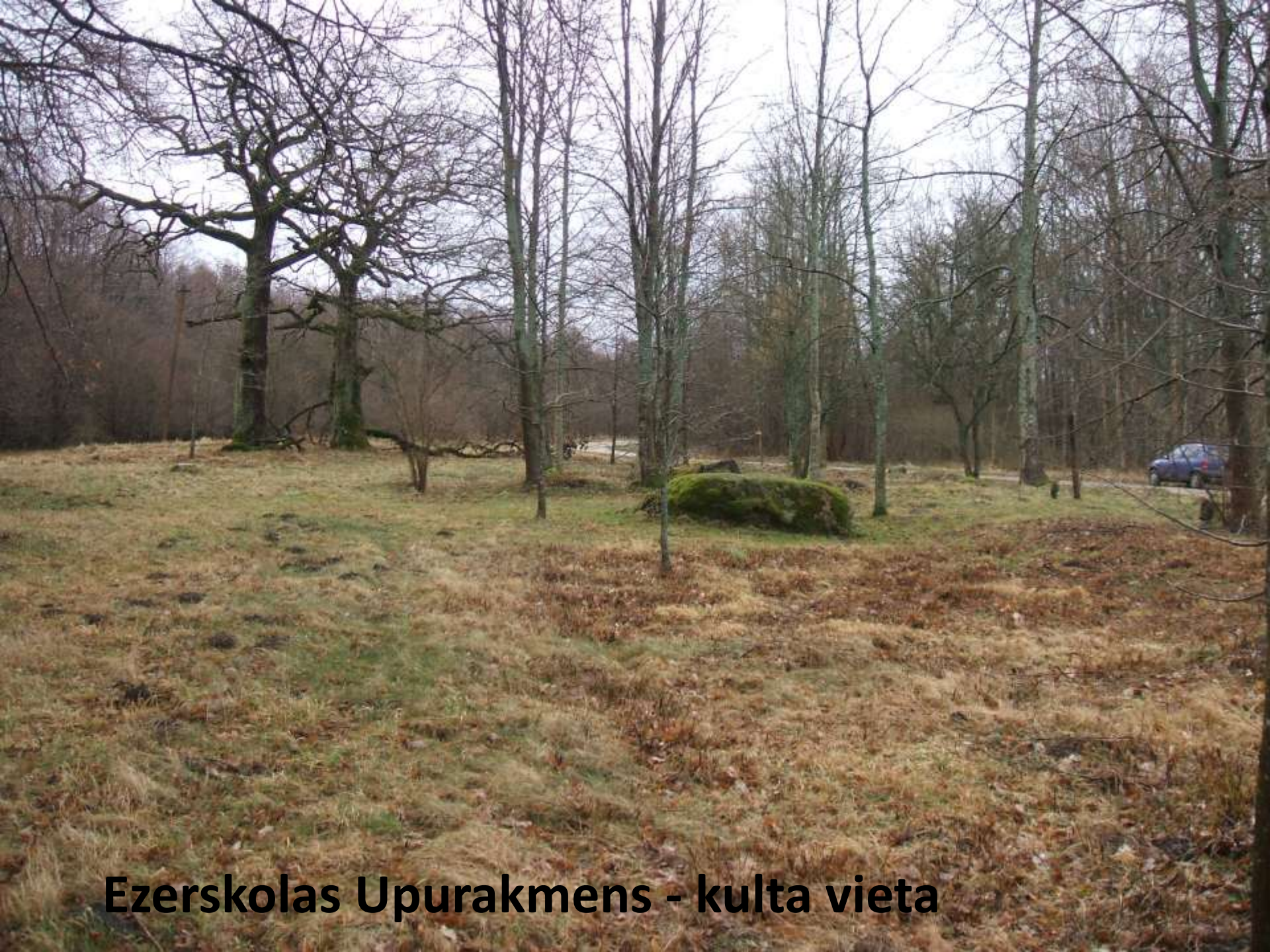
Ezerskolas Upurakmens - kulta vieta