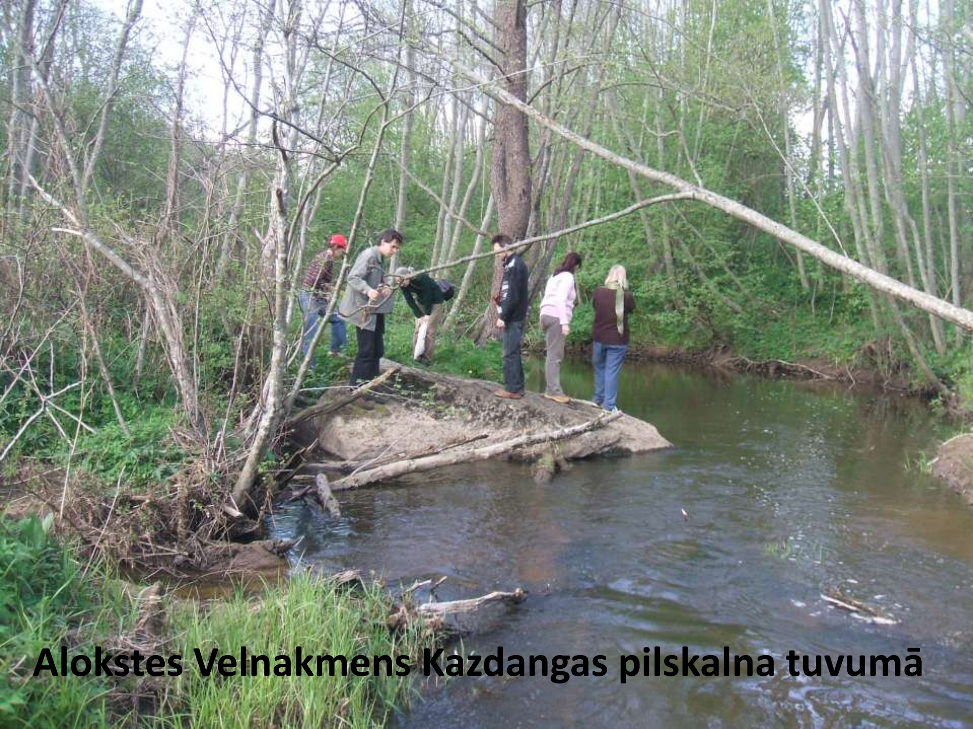
Alokstes Velnakmens Kazdangas pilskalna tuvumā