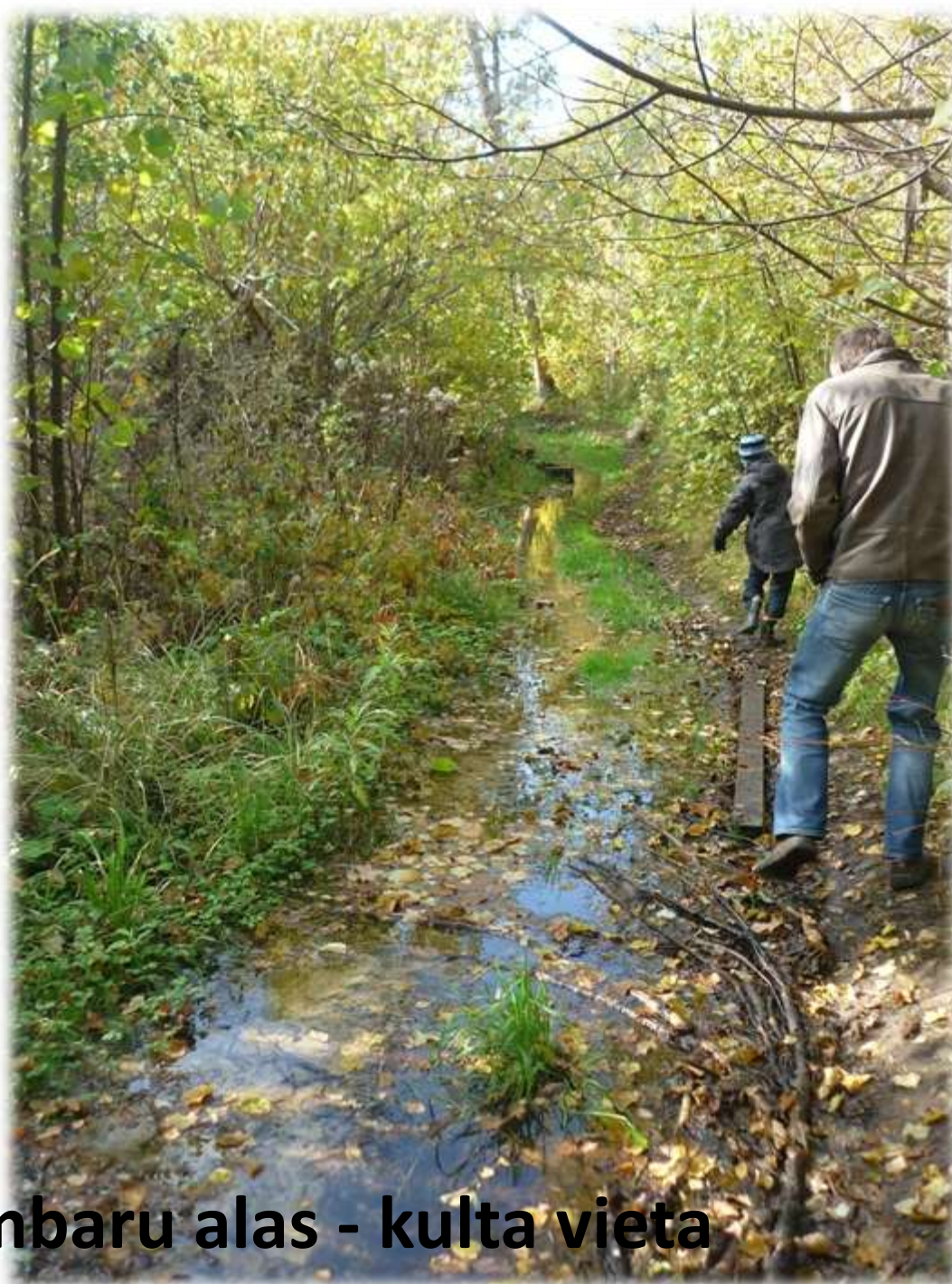
Māras kambaru alas - kulta vieta