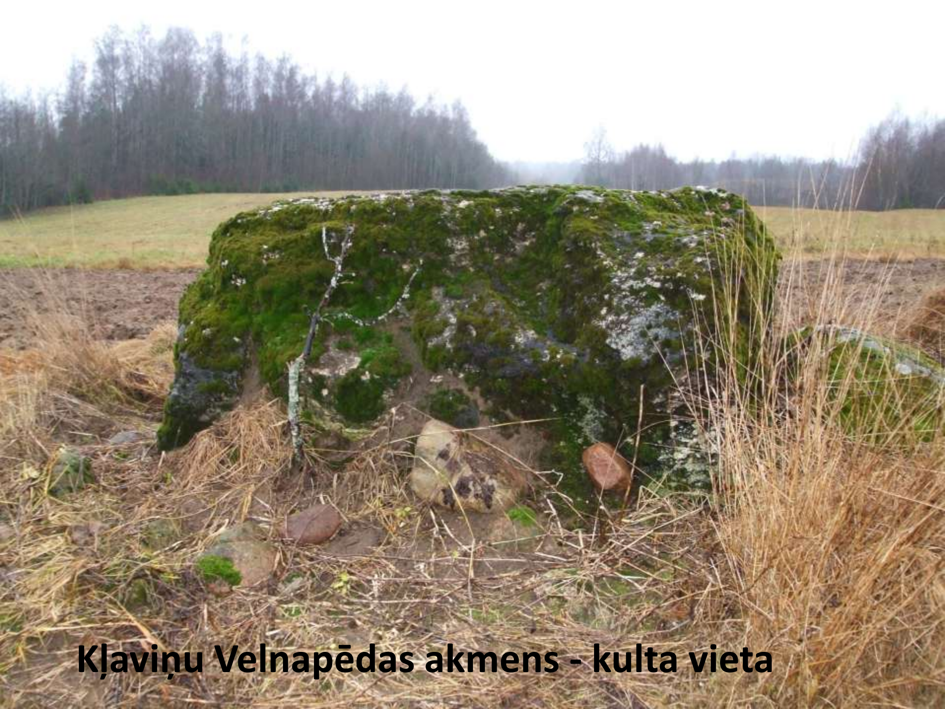
Kļaviņu Velnapēdas akmens - kulta vieta