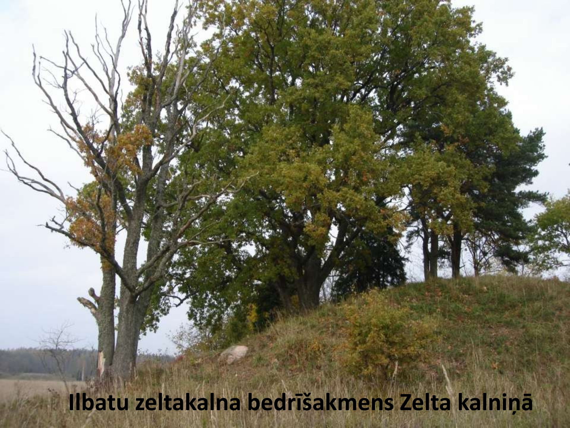
Ilbatu zeltakalna bedrīšakmens Zelta kalniņā