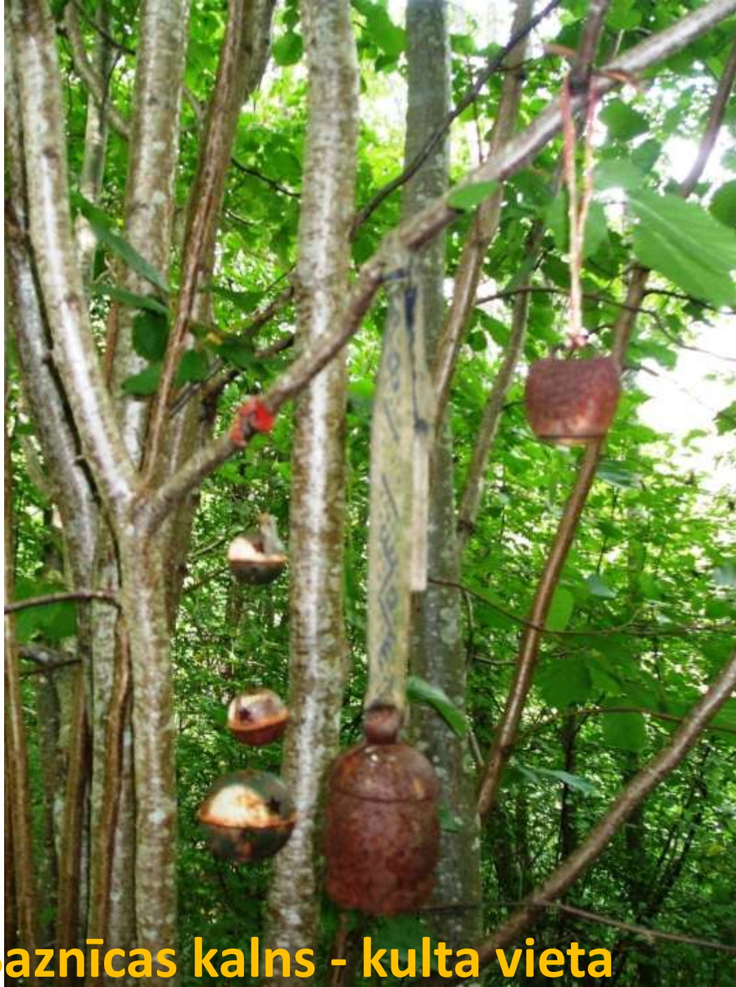
Valgales Baznīcas kalns - kulta vieta